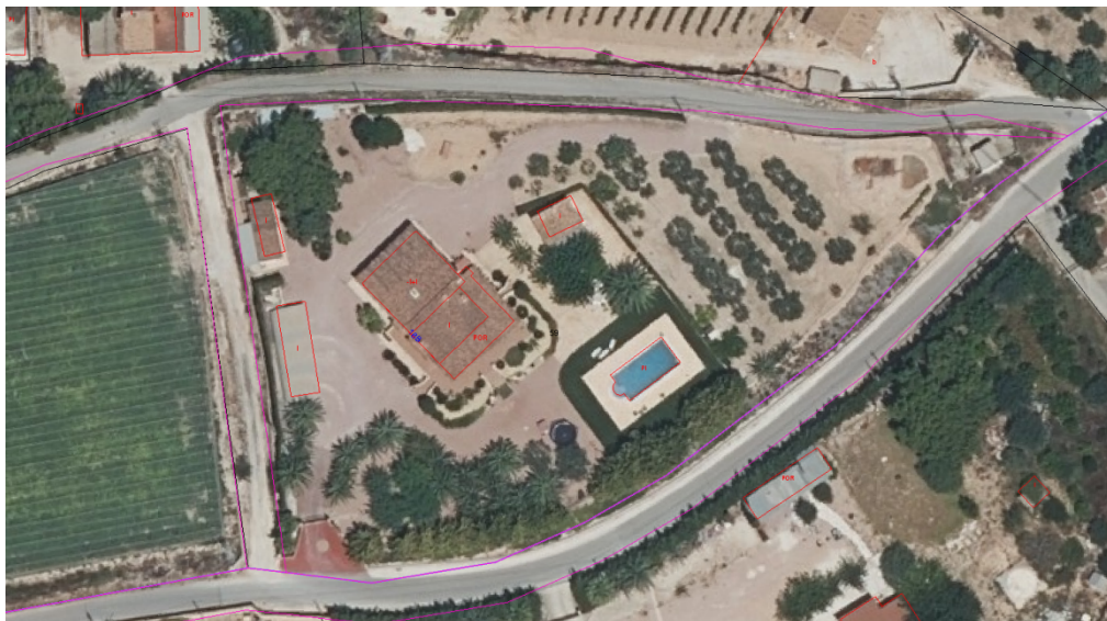
Ortofoto aérea vuelo año 2023, sobre base catastral

Plaza de España, 1 (03660) Telf: 965 60 26 90 CIF: P0309300B / DIR3: L01030937