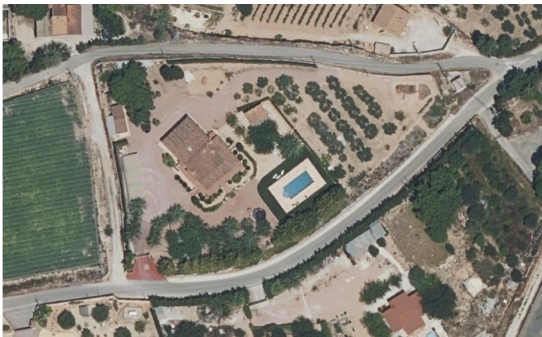
Ortofoto aérea vuelo año 2023

Plaza de España, 1 (03660) Telf: 965 60 26 90 CIF: P0309300B / DIR3: L01030937