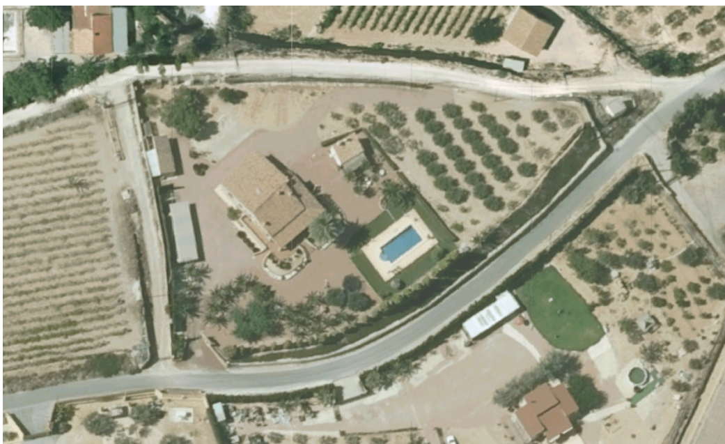
Ortofoto aérea vuelo año 2014

Tal y como ha quedado patente en las ortofotos que se han ido aportando en los puntos anteriores del presente informe, las construcciones estaban completamente finalizadas y dispuestas para su uso antes del 20 de agosto de 2014, a excepción de los cobertizos adosados a los linderos norte y oeste. Se puede comprobar cómo la traza exterior de las construcciones no ha sufrido variación alguna desde el año 2.014 hasta la actualidad, a excepción de los citados cobertizos.